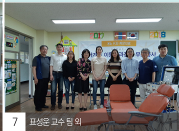
7 표성은 교수 팀 외