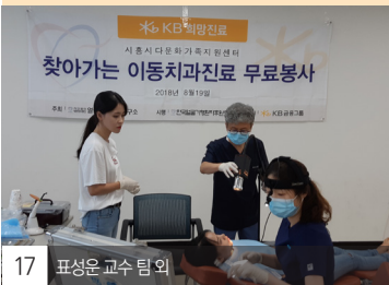
17 표성은 교수 팀 외