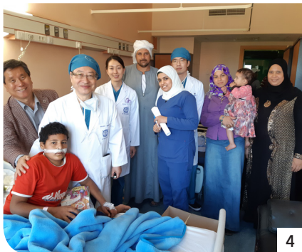
4 퇴원 선물을 받은 환자와 작별인사를 하는 봉사팀과 현지 의료진.