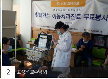
2 표성은 교수팀 외